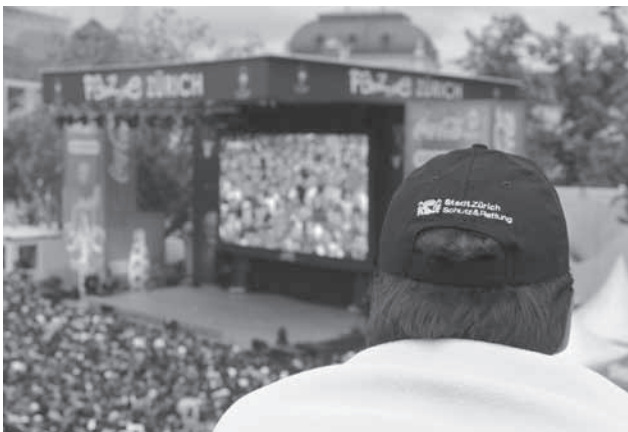
Während der EURO 2008 wurde das Geschehen in der Fanzone am Bellevue diskret beobachtet.